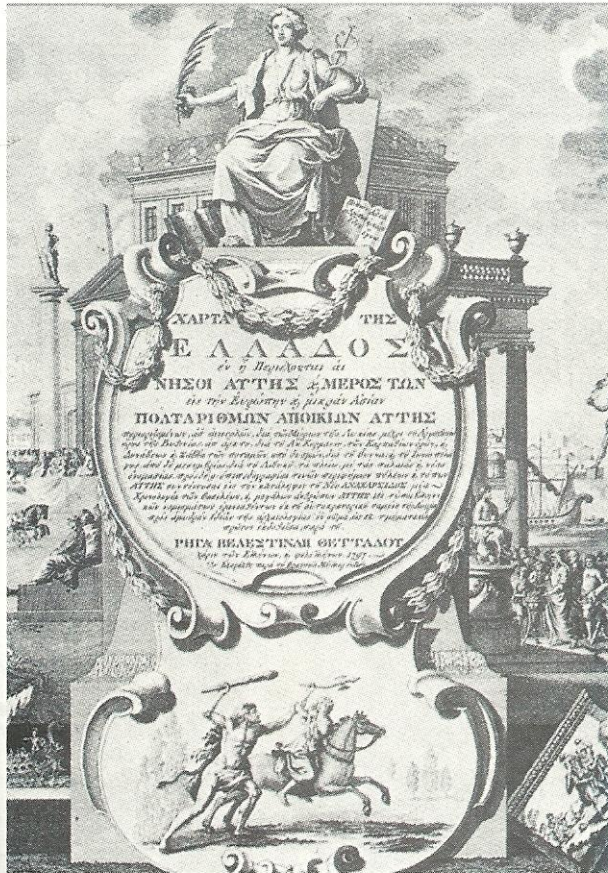
Η Χάρτα του Ρήγα